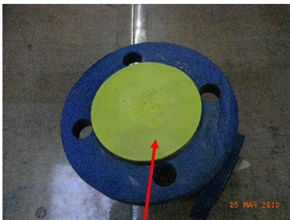
Abbildung 6.1-1: Flanschabdeckung Kunststoff

Achtung: Sitzdichtfläche und Arbeitsleisten schützen, sonst Beschädigung!