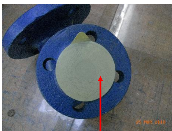
Abbildung 6.1-2: Flanschabdeckung Aufkleber